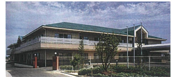
（愛生苑建物の外観）

※JRで来られる方は、八十場駅を降り、左へ歩いて下さい。すぐに、押しボタン信号があります。そこを渡り、まっすぐ歩いていくと県道16号線に出ます。16号線まで出ると愛生苑が見えます。（所要時間約15分）