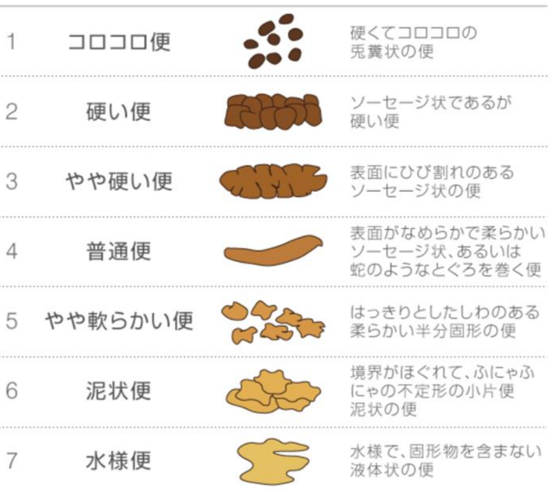
ブリストルスケール