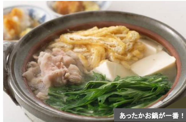
あったかお鍋が一番！