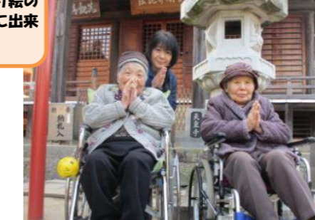
白峰宮に参拝に出かけました。