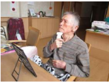
生活リハビリの様子です。真剣な表情で集中力アップですね。