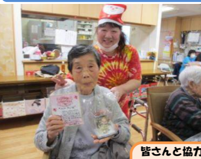
皆さんと協力して作った冬の切り絵の観賞会！素敵に出来上がりました。