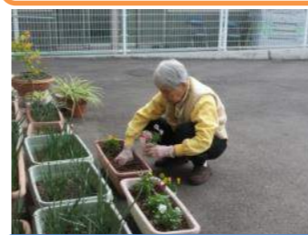
玄関前に季節の花を植えて皆様をお出迎えします。