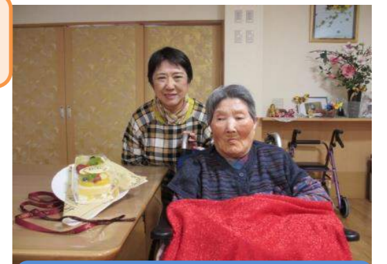
ご家族様が、バースデイケーキを持って駆けつけてくださいました。