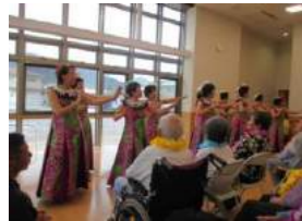
ボランティアの方々、いつもありがとうございます。楽しい時間を過ごすことができました。