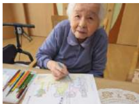
お話し相手も増えました。