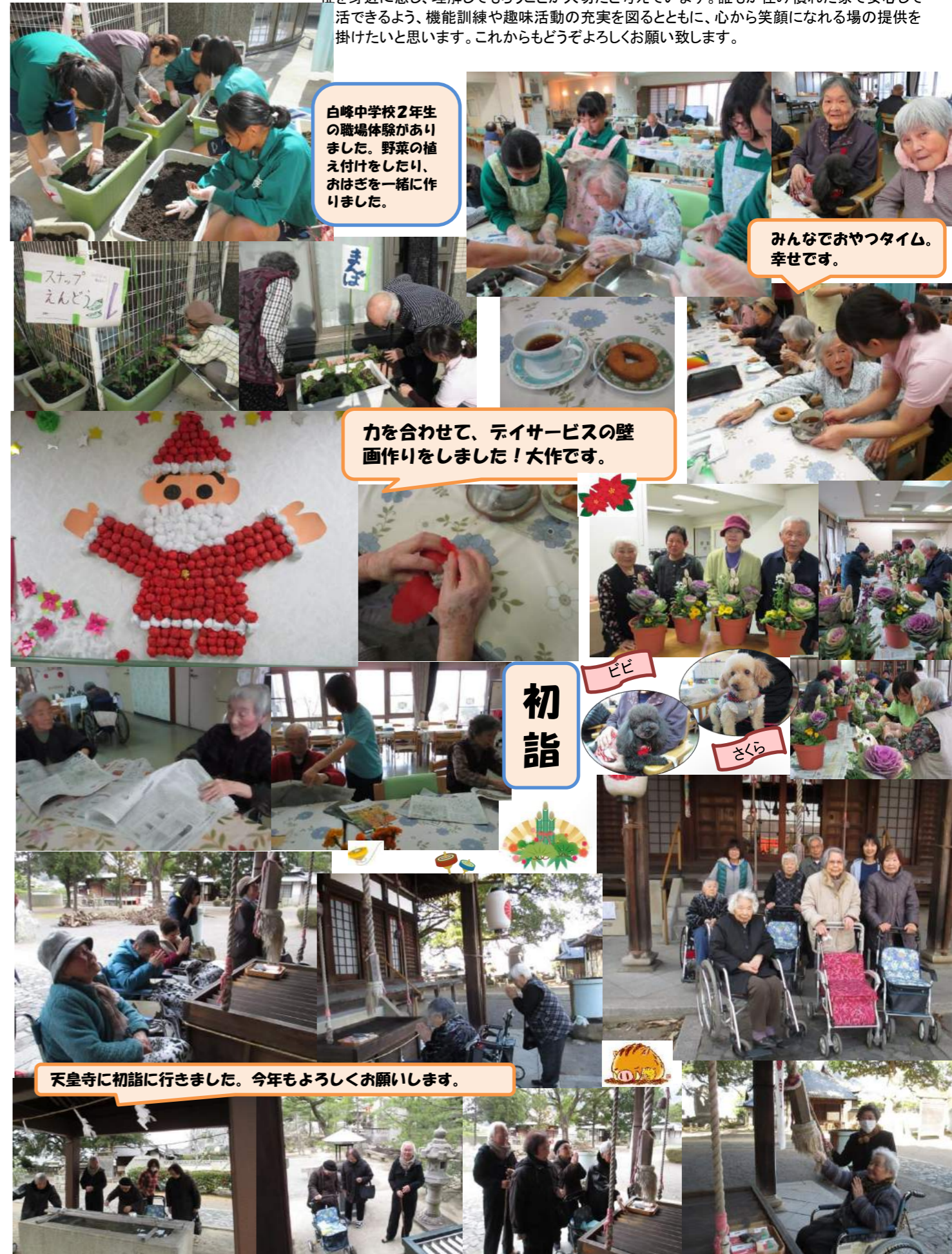
白峰中学校2年生の職場体験がありました。野菜の植え付けをしたり、おはぎを一緒に作りました。

♥デイサービスのご利用者様、ご家族様、関係機関の皆様、いつも温かい笑顔と優しさをありがとうございます。今年度は世代間交流・地域の中のデイサービスとして中高生体験学習を積極的に受け入れて来ました。高齢になっても安心して地域で暮らすには次世代の子供達に福祉を身近に感じ、理解してもらうことが大切だと考えています。誰もが住み慣れた家で安心して活できるよう、機能訓練や趣味活動の充実を図るとともに、心から笑顔になれる場の提供を掛けたいと思います。これからもどうぞよろしくお願い致します。