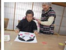
正月恒例の福笑いゲーム2人で協力して行いました。こんなに上手に完成しました。ナイスペアですね。