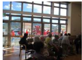
見て・笑って・感じてこのひとときを存分に楽しみました。またのご来苑をお待ちしています。