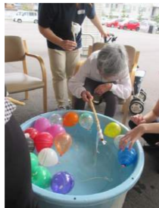
愛生苑祭りでは、ゲームやフードコートを楽しみました。