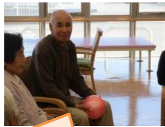
ボール送りゲーム！皆さん、一丸となって楽しんでいます。