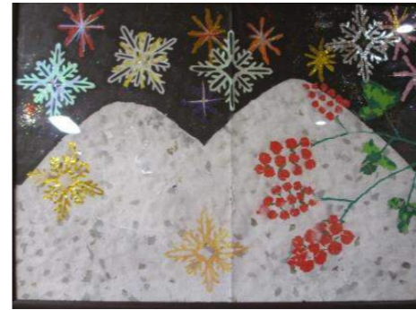
雪山に輝く結晶。幻想的です。これから春に向けて、次作品の作成に頑張ります。

♥ 「まほろば」では29名の方が利用されています。通い・訪問・泊まりのサービスを柔軟に利用して頂けます。「まほろば」は素晴らしい場所という意味です。「馴染みの場所」で「馴染みのスタッフ」と「アットホーム」な雰囲気の中で温かい時間を過ごしています。新しい年号を迎える本年も、皆さまにとって「素晴らしい場所」になりますよう努力してまいります。